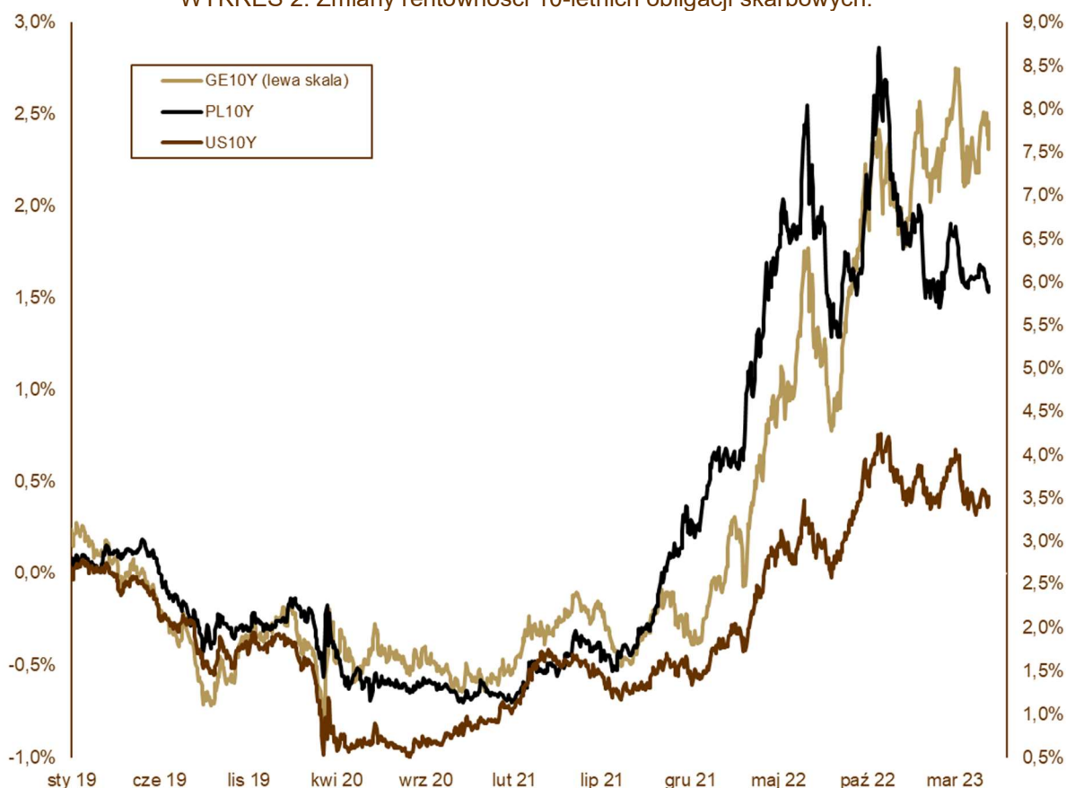
WYKRES 2. Zmiany rentowności 10-letnich obligacji skarbowych.