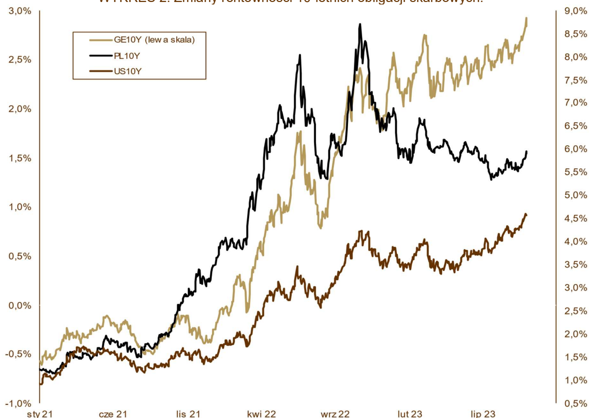
WYKRES 2. Zmiany rentowności 10-letnich obligacji skarbowych.