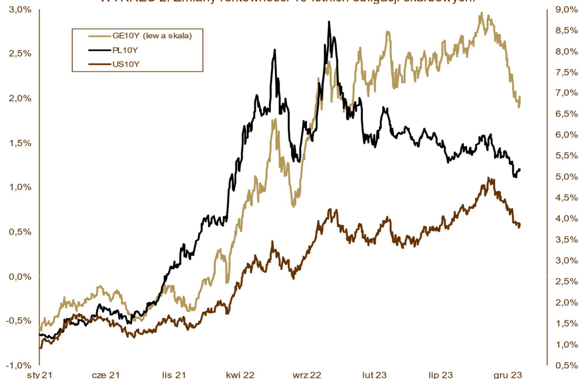
WYKRES 2. Zmiany rentowności 10-letnich obligacji skarbowych.