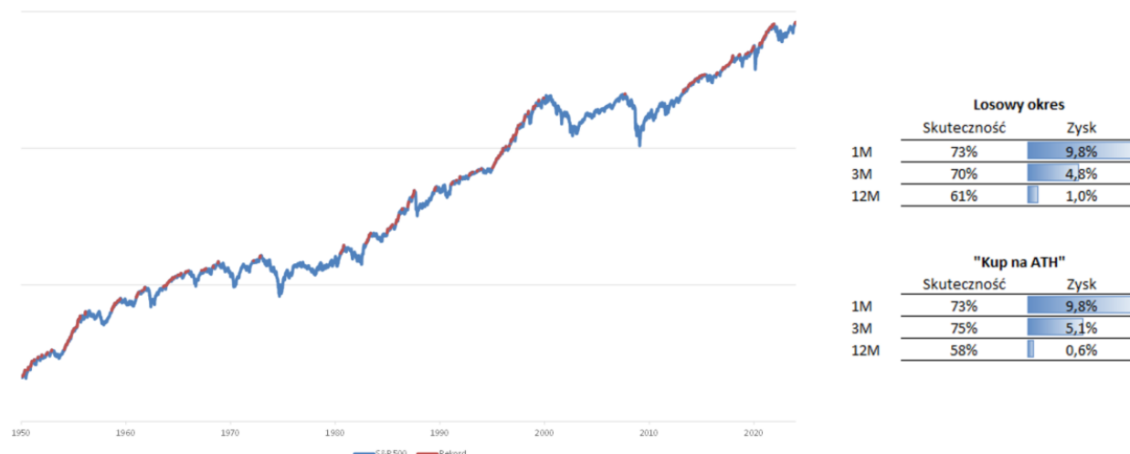
Wykres. 2. Szczyt na S&P 500 nie jest niczym nadzwyczajnym