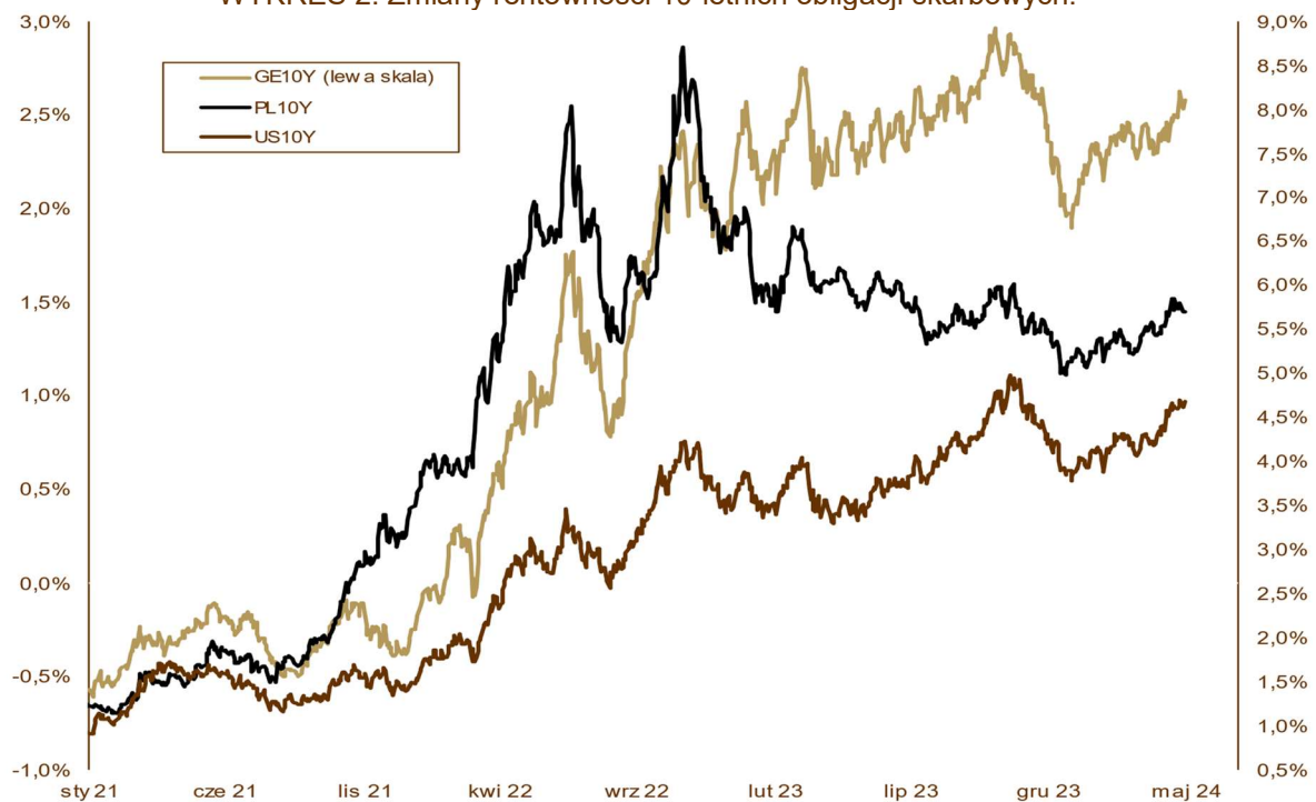
WYKRES 2. Zmiany rentowności 10-letnich obligacji skarbowych.